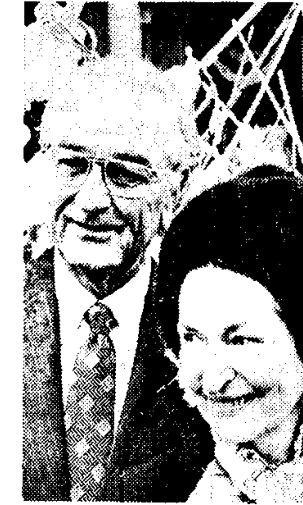
Πρόσφατη φωτογραφία του έκλιπτόντος χθές πρώην 'Αμερικανού προέδρου Λίντον Τζόνσον, με τή σύζυγό του Λαίνα Μπέρντ. Τελευταίος, ό Τζόνσον εχε έπιστρέψι πολλές φορές σέ νοσοκομείο εξ αιτίας άλλοπαλλών καρδιακών κρίσεων. Η νεκρή ήταν και ή μορφή.

Λίγο μετά τό θάνατο του Λίντον Τζόνσον, ό Πρόεδρος Νίξον, διά τού έπί του Τύπου έμπροστού του Ρόναλντ Ζηνγκερ, άνακοίνωσε τή θέση. • 'Ηταν ένας άνοητικός άγέτης, μία μοναδική προσωπικότητα και ένας άνθρωπος, βατών θανατηφόρων και άδολογητό θάνατος. Είναι βέβαιος θάνατος να γεννηθεί ότι ένα άδολο ή σημασία κωμωδίας κωμωδίας για τό θάνατο του Χαρρυ Τρούμαν, άλλα ένας από τούς ένέτες μας έπρετ. Πιθανό ότι, όσες τό άπό τόν έπί θάνατο, ό άνακοίνωσός της θα είναι βεβαίως τή μήνη του άμερικανικού λαού. • Ο άντιπαρτασλίδης κ. Σπύρος 'Αγκυλιός έλεγε τό έξής. • Ο θάνατος του παύδου Τζόνσον μάς